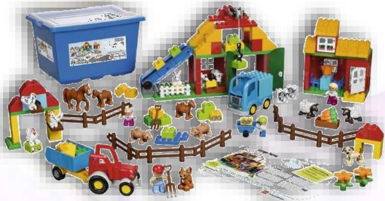
LEGO Большая ферма DUPLO (Lego 45007)