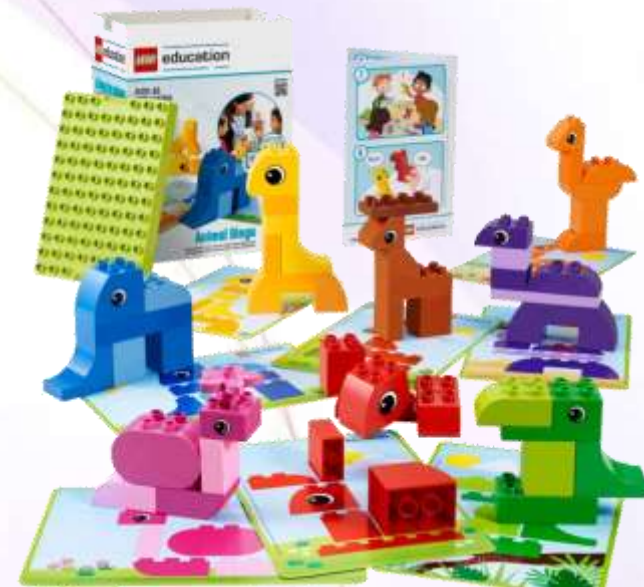
Комплект Lego Duplo Лото с животными (45009).