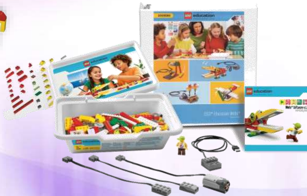
Lego WeDo 01. Education